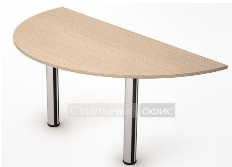
Модель 2СЭ.010, серия Стиль, 2 штуки, 3680 руб.